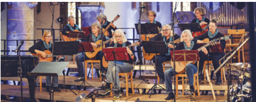
Band- und Chorfestival 2024 – Pälzer Saidezerrer