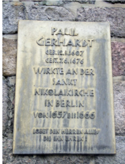
Gedenktafel an der Nikolaikirche in Berlin

Paul Gerhardts Lebenszeit war geprägt von tiefgreifenden Erschütterungen. Der Dreißigjährige Krieg hatte Mitteleuropa verwüstet, ganze Landstriche