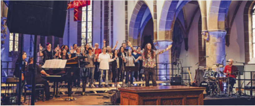
Band- und Chorfestival 2024 – Popsound