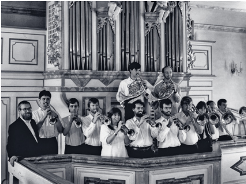
Pfälzisches Bläserensemble 1990