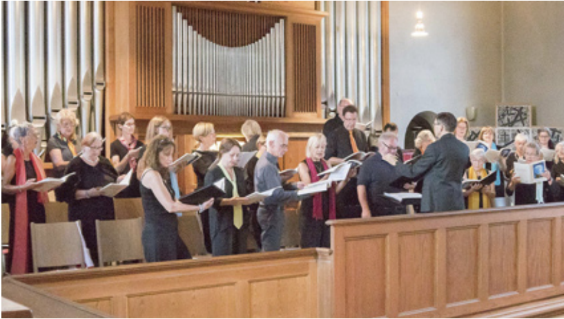
Projektchor Ludwigshafen

Um die Attraktivität der Projekte weiter zu steigern, können zusätzliche Angebote integriert werden wie etwa kostenlose Stimmbildung während der Projektphasen. Solche Elemente erhöhen die musikalische Qualität und schaffen gleichzeitig einen Anreiz und Mehrwert für die Teilnehmenden.