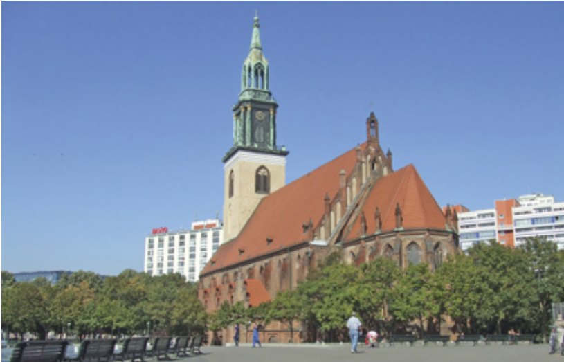
Nikolaikirche in Berlin

Gerhardts Theologie ist lutherisch geprägt, aber alles andere als trocken oder lehrhaft. Sie findet ihren Ausdruck in Bildern, Metaphern und einer Sprache, die Nähe schafft. Seine Lieder sprechen von Gott als verlässlichem Gegenüber, vom Vertrauen in Gottes Nähe, von der Freude an der Schöpfung und von der Hoffnung über den Tod hinaus. Gerade diese Verbindung von theologischer Klarheit und poetischer Anschaulichkeit lässt seine Texte bis heute leuchten.