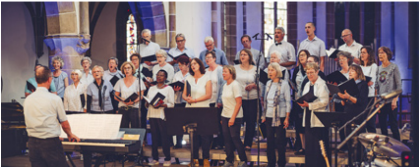
Band- und Chorfestival 2024 – Crescendo Essingen

Den Auftakt bildet unser schon zur Tradition gewordenenes Pfälzisches Band- und Chorfestival in der Stiftskirche in Landau. Es startet um 14 Uhr mit der Eröffnung durch Landeskirchenmusikdirektor Jochen Steuerwald. Für gute Laune und fetzigen Sound sorgt dabei erneut die NeW Brass Big Band unter Ralph „Mosch“ Himmler.