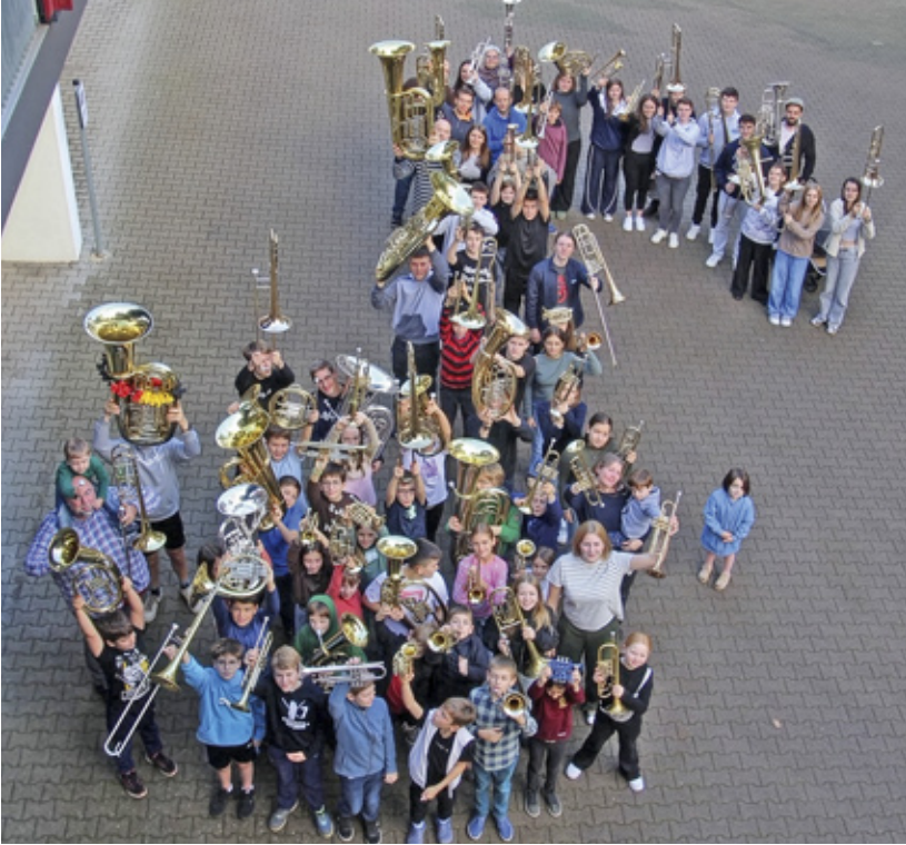
Herbstfreizeit 2024

zu verfeinern, trafen und treffen sich mindestens zwei- bis dreimal im Jahr, um besondere Gottesdienste oder Feierstunden musikalisch auszugestalten. Ebenfalls im Jahr 1956 schlossen sich die CVJM-Posaunenchöre dem Landesverband an.